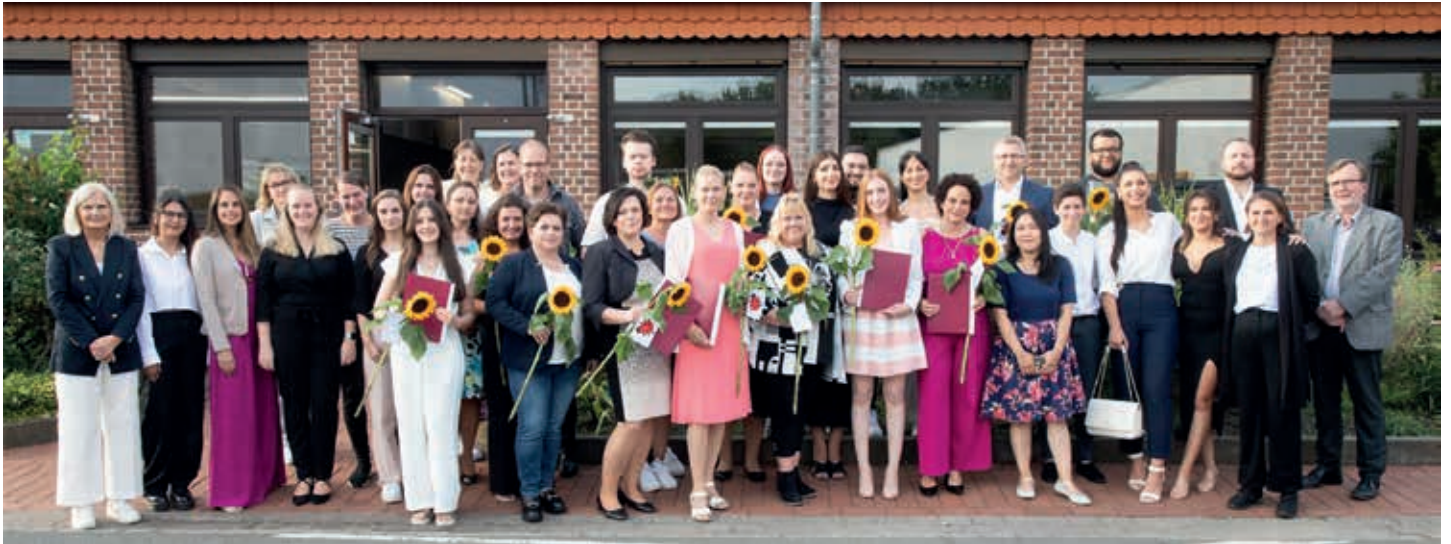
Text & Bild: Bettina Goczol

Abschluss - das bedeutet Abschied, aber auch Neuanfang. 33 Absolventinnen und Absolventen des Edith-Stein-Berufskollegs für Pflegeberufe in Warendorf feierten diesen Beginn des neuen Lebensabschnitts im Rahmen ihrer Examenfeier zur bestandenen generalistischen Pflegeausbildung. In der Cafeteria der Freckenhorster Werkstätten freuten sich Familien, Freunde, Träger und Lehrende mit den frisch examinierten Pflegefachkräften.