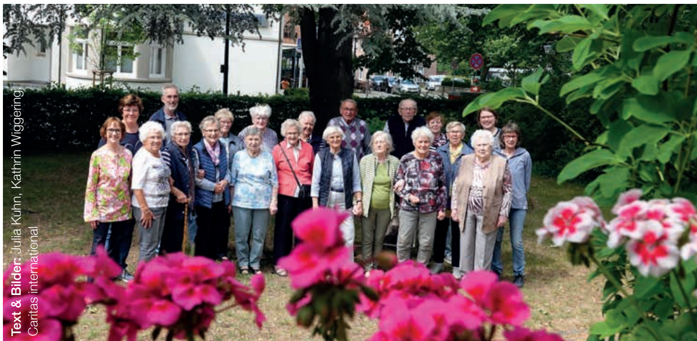
Text & Bilder: Julia Kuhn, Kathrin Wiggering, Caritas international